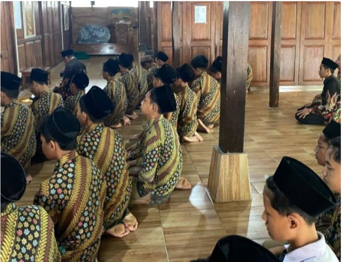
Ruh Pagi Menyala di SMP Persada Insan Nusantara Tebuireng 17 Sokaraja

SOKARAJA - SMP Persada Insan Nusantara, unit pendidikan di bawah PP Abdul Djamil Tebuireng 17 Sokaraja, Banyumas, terus meneguhkan komitmennya dalam membangun karakter peserta didik melalui pembiasaan ruhaniyah. Seperti hari ini Rabu pagi (03/12/2025).